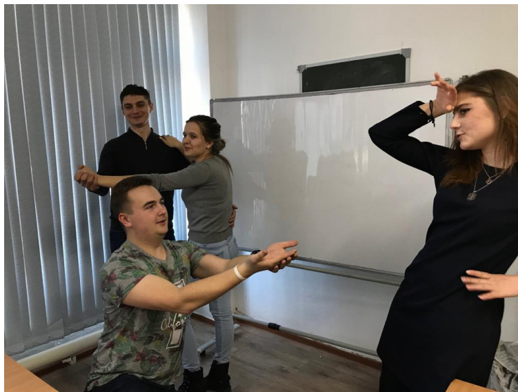
Рисунок 2. Изображение статуи

Студенты изображали с помощью статуй конкретные социальные ситуации, отношения между людьми, события, которые они представляли в своем воображении. Нужно отметить активное участие обучающихся в обсуждении статуи, их эмоциональный интеллект и фантазии. Студенты рассматривали картину со всех сторон, говорили об ассоциациях и чувствах, которые она у них вызывала, высказывали и обосновывали свои мнения.