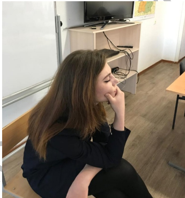
Рисунок 1. Метод «Путешествие в фантазии»

После пребывания в фантастическом мире обучающиеся возвращались в реальность. Открыв глаза и расслабившись, студенты размышляли о своих впечатлениях, обменивались опытом собственного «путешествия» в группе, рассказывали о своих ощущениях. Завершающим этапом было построение обучающимися статуй, позволивших дать образные представления о конкретных моментах.