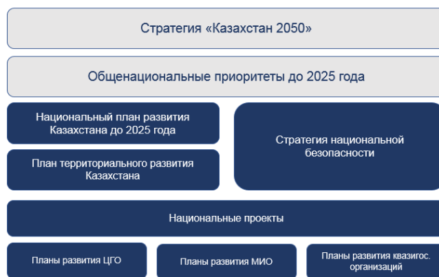
Рисунок 1. Современная система государственного планирования в Республике Казахстан