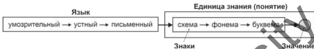
Рисунок 4. Функциональный алгоритм построения однозначных знаний

Для совместного построения и согласования однозначных понятий и категорий педагогической парадигмы предлагается использовать трёхязычие, то есть три типа языков: умозрительный, устный и письменный, оперирующих соответствующими знаками — схемы, фонемы и буквы. Умозрительный язык функционально-схематических изображений мысли (ЯФСИ) выступает организующим по отношению к любому устному и письменному языку. На рисунке 4 показан функциональный алгоритм построения понятия как такового. Здесь понятие — единица знания, содержащая знаки, отсылающие к одному значению. Соответственно, если слово не понимается однозначно, ему присваивается статус представления или предпонятия, но не понятия.