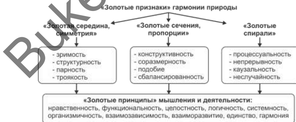
Рисунок 2. «Золотые принципы» природоподобного мышления и деятельности

В этих «золотых признаках» и «золотых принципах» и проявляется единство и гармония природы [8]. Обобщая их, выводим следующие «золотые принципы» природоподобного мышления и деятельности: нравственность, функциональность, целостность, логичность, системность, организмичность, взаимозависимость, взаиморазвитие, единство, гармония (рис. 2).