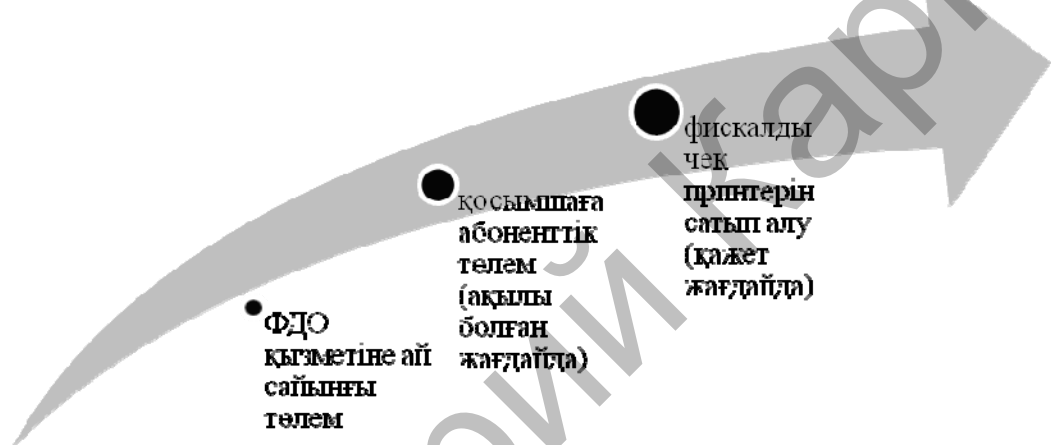
Сурет 2. БКМ-қосымшаны орнатуда кәсіпкердің шығыны

2- суретте БКМ-қосымшаны орнатуда болатын кәсіпкердің шығындары келтірілді: