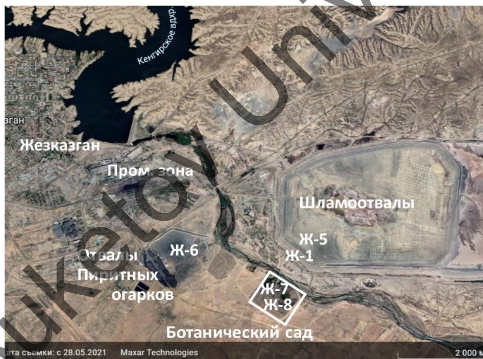
Рисунок 1. Жезказганский ботанический сад. Точки опробования

Рекогносцировочное обследование почв Ботанического сада и его окрестностей было проведено авторами в октябре 2021 года (рис. 1).