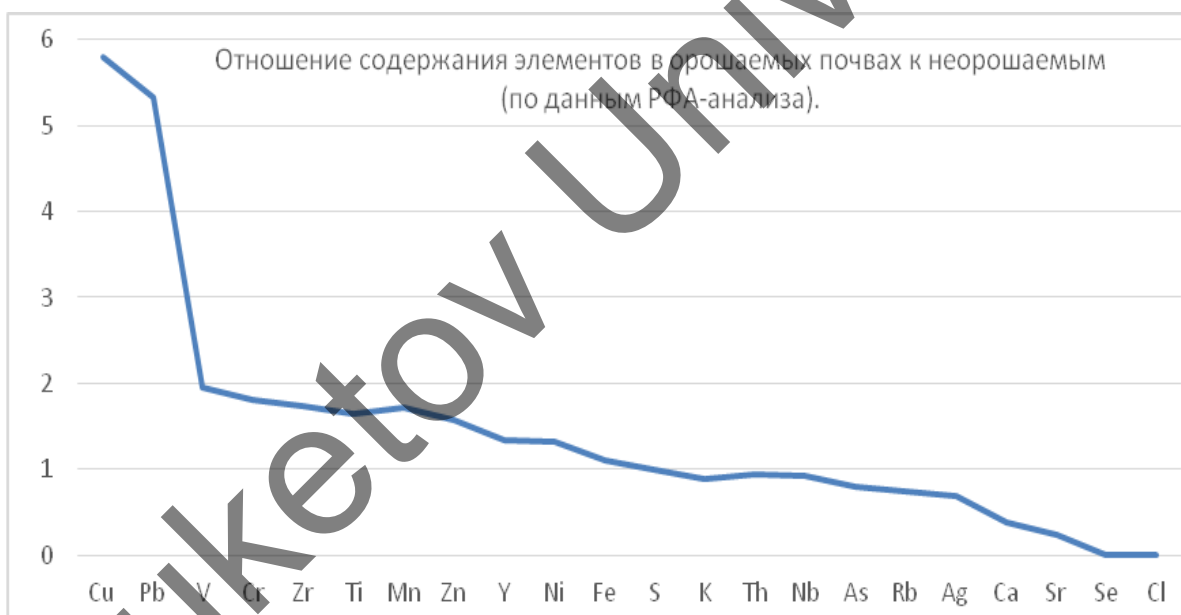
Рисунок 2. Загрязнение орошаемых почв Жезказганского ботанического сада

Превышение содержания элементов в орошаемых почвах по сравнению с неорошаемыми показано на графике (рис. 2). Так, накопление Cu и Pb составляет 5–6 раз. Активные водные мигранты — Cl, Se, Sr, Ca — выносятся из орошаемых почв. Для серы соблюдается баланс выноса и закрепления в почве.