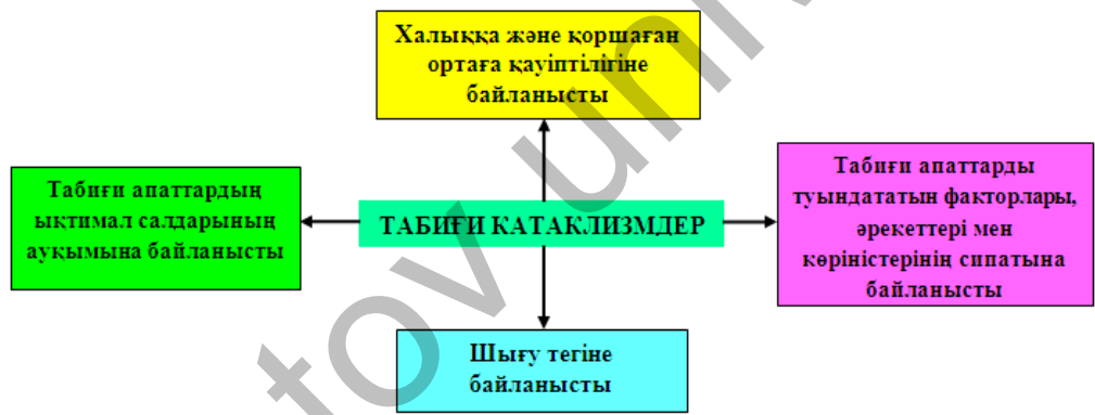
2-сурет. Табиғи катаклизмдердің жіктемесі (Н.В. Крепшаның еңбегінің негізінде құрастырылды)