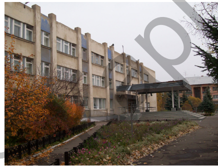
Рисунок 4. Средняя общеобразовательная школа

Центральные улицы города характеризуются двойственным отношением респондентов, поскольку, с одной стороны, в них сконцентрировано большое количество всевозможных ярких, интересных, броских цветовых решений вывесок, рекламных щитов, которые вызывают положительный эффект у части респондентов, а с другой — разнообразие и хаотичность стилистических решений этих объектов часто утомляют зрение и вызывают раздражение у другой части респондентов. Не последнюю роль играет сочетание такого неорганизованного видеоряда с шумовым воздействием на главных магистралях, которое лишь усиливает враждебное отношение и нарушает равновесие человека.