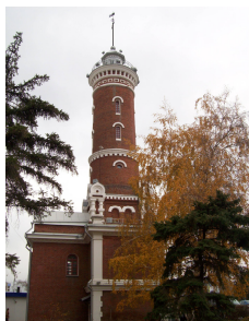
Рисунок 7. Пожарная каланча

Неоднозначное отношение к малым архитектурным формам связано с тем, что некоторые из них (Тарские ворота, Пожарная каланча (рис. 7)) воспринимаются горожанами положительно, как символы города. А памятники историческим деятелям (Ф.М.Достоевскому (рис. 8)) в основном воспринимаются негативно, по-видимому, такое отношение связано со стандартностью, статичностью этих памятников и отсутствием оригинальных художественных решений.