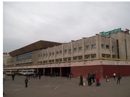
Рисунок 6. Автовокзал

Спортивные сооружения вызывают противоречивое отношение, поскольку положительная смысловая наполненность этой группы зданий, связанная с активным отдыхом, сочетается с отрицатель-