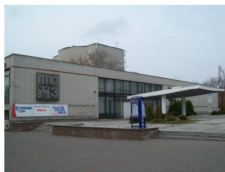
Рисунок 2. Театр юного зрителя

Зеленые массивы, с одной стороны, являются своеобразными «легкими» города, которые облагораживают и динамизируют статичную городскую среду, а с другой — противоречивое отношение горожан проявляется в том, что не во всех парках созданы условия для комфортного отдыха; заброшенность некоторых территорий несет в себе потенциальную опасность; здесь повсеместно встреча-