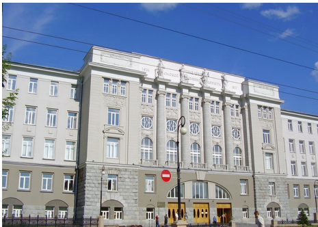
Рисунок 3. Омский государственный университет путей сообщения

Противоречивое отношение респондентов к образовательным учреждениям объясняется тем, что одни из объектов этой группы находятся в зданиях историко-культурного значения, насыщенных декоративными элементами (Омский государственный университет путей сообщения (рис. 3)), а другие — в зданиях типовой постройки советского периода с однородными полями, без декоративных элементов (школы (рис. 4), большинство вузов).