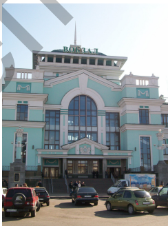
Рисунок 5. Железнодорожный вокзал

Объекты транспортной инфраструктуры вызывают противоречивое отношение респондентов. Так, например, железнодорожный вокзал (рис. 5) — архитектурный памятник и своеобразное «лицо» города — вызывает положительное отношение. А здание автовокзала (рис. 6) отмечено многими горожанами негативным отношением. Всеобщая нелюбовь связана не только с серостью, угловатостью, обилием агрессивных полей, но и с атмосферой неуюта, скученности, которая царит в нем.