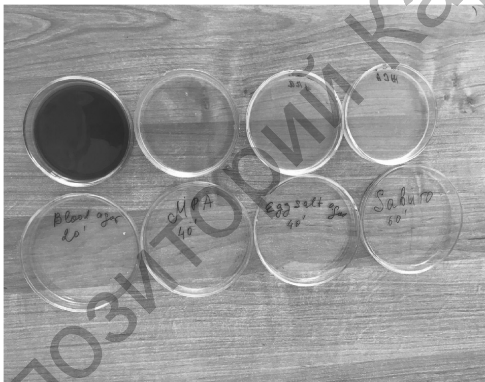
Рисунок 1. Забор материала

Чашки Петри распределялись в исследуемой комнате по диагонали в трех позициях (у окна, в середине учебной комнаты и у двери) (рис. 1).