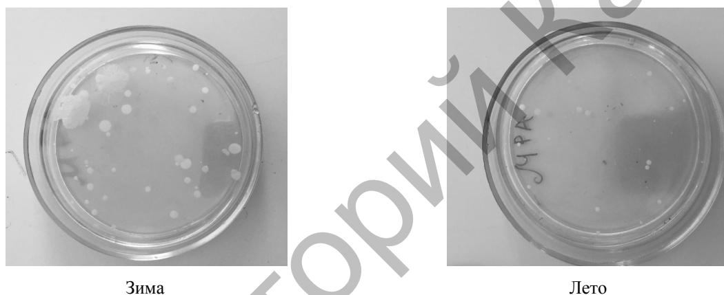
Рисунок 2. Количество микроорганизмов в учебной комнате в различные периоды года

Нами также проведен анализ микрофлоры воздуха в учебной комнате в трех позициях по диагонали. Из образца, взятого зимой до начала первого урока, получены следующие результаты: у окна 2467 КОЕ/м 3 , в середине учебной комнаты 2051 КОЕ/м 3 и возле двери 2250 КОЕ/м 3 , при среднем значении 2256 КОЕ/м 3 . Существенные отличия в показателях не установлены, воздух при всех значениях в различных точках забора оценивался как умеренно загрязненный. Однако данная тенденция сохранялась в образцах воздуха и после урока. В летний период ОМЧ у окна составило 990 КОЕ/м 3 , затем, по убывающей, 943 КОЕ/м 3 возле двери, наименьшее количество в середине комнаты — 926 КОЕ/м 3 . Воздействие естественного ультрафиолета должно оказывать бактерицидное действие, полученные нами результаты противоречат литературным данным [12]. Мы полагаем, что в данном случае синтетические жалюзи являются пылесборником, в какой-то степени мишенью для фиксации микроорганизмов. Однако данное предположение требует дальнейшего детального изучения.