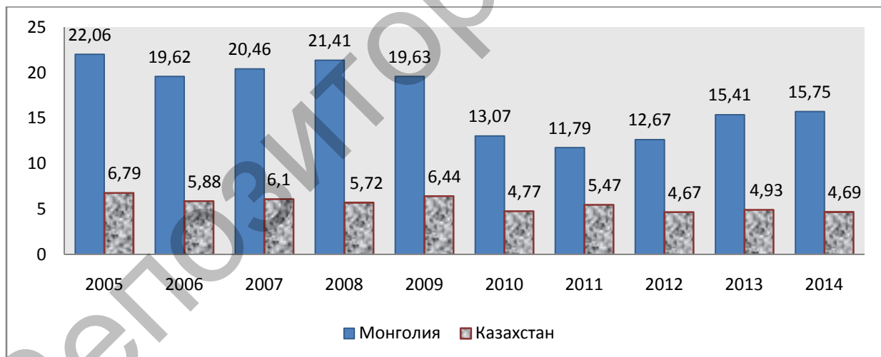
Рисунок 4. Изменение доли сельского хозяйства в ВВП Монголии и Казахстана за 2005-2014 гг., % (источник [7, 8])

В условиях перехода к рыночной экономике значение сельского хозяйства, в котором занято более 30 % населения Монголии, значительно возрастает. Так, сельское хозяйство Монголии до 2009 г. в среднем давало около 20 % ВВП страны, а в Казахстане — только около 6 % (рис. 4). Доля сельского хозяйства в структуре ВВП в 2014 г. в Монголии составила 15,75 %, а в Республике Казахстан — только 4,69 % и имеет тенденцию к снижению. Несмотря на рост фактических показателей выпуска продукции сельского хозяйства и в Монголии, и в Казахстане, снижение доли сельского хозяйства в последние годы связано с ростом общего объема ВВП, в том числе значительным ростом отраслей промышленности. Но и в Казахстане, и в Монголии приоритету развития сельского хозяйства уделяют огромное внимание.