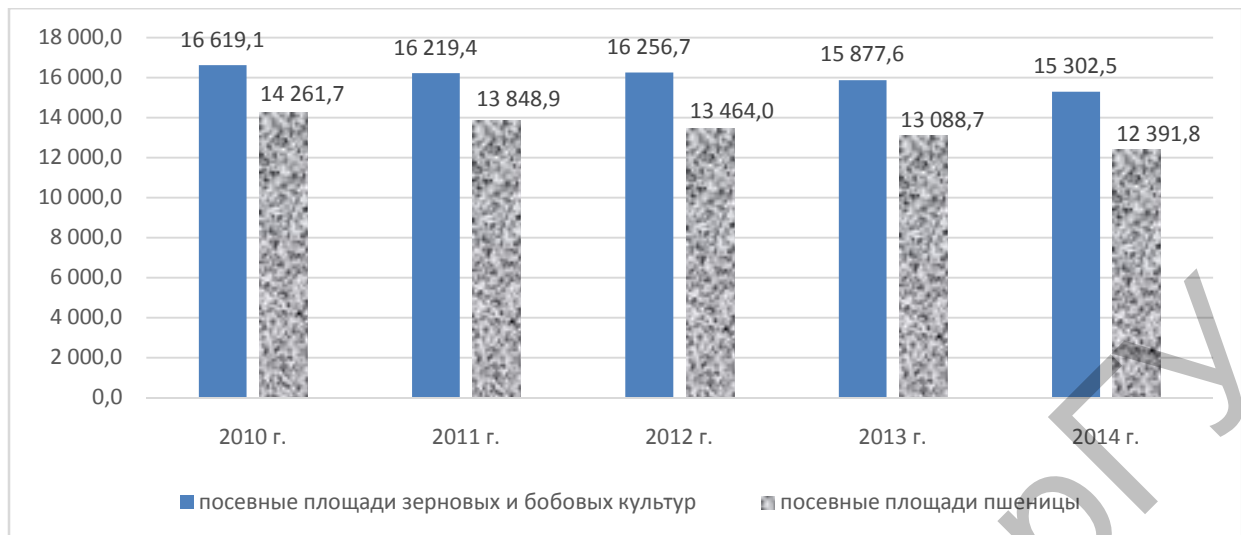
Рисунок 2. Посевные площади зерновых и бобовых культур Казахстана, тыс. га (источник [3, 4])

В 2014 г. было собрано 17 162,2 тыс. тонн зерновых (включая рис) и бобовых культур. Валовый сбор пшеницы составил 12 996,9 тыс. тонн. Средняя урожайность зерновых (включая бобы) составила 11,7 центнера с гектара, в том числе урожайность пшеницы составила 10,9 центнера с гектара.