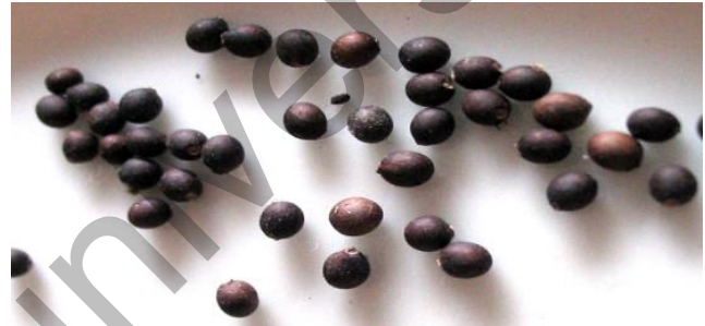
2-сурет. Salvia officinalis тұқымы

Сондықтан да Origanum vulgare тұқымынан стерильді өскіндер алу мақсатында әртүрлі тәсілдерді байқап көрдік. Origanum vulgare өсімдігінің тұқымын залалсыздандыру үшін 5 тәсіл қолданылды (3-сур.).