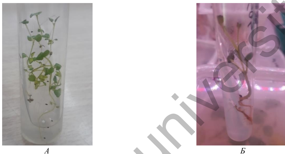
4-сурет. Тұқымнан өсіп шыққан Origanum vulgare (А) және Salvia officinalis (Б) өсімдігі

Тұқымдар 3 күннен бастап өне бастады, ал 30–40 күн ішінде өсіп шықты (4А-сурет). Сол пробиркада өсіп шыққан өсімдіктердің жапырақтары мен сабақтары Origanum vulgare қаллустық культурасын алу мақсатында пайдаланылады.