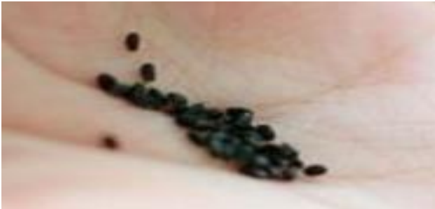
1-сурет. Origanum vulgare тұқымы

Өсімдіктердің оқшауланған клеткаларын және мүшелерін in vitro жағдайында табысты өсірудің маңызды шарты бастапқы өсімдік материалынан асептикалық, зақымдалмаған таза культураны алу болып саналады. Көптеген өсімдіктерде тұқымнан in vitro өсірілген өскіндердің ұлпалары мен мүшелері өте жиі пайдаланылады, себебі олар кейде жетілген өсімдіктермен салыстырғанда жоғары каллус түзуші және морфогенездік қабілеттілікке ие болып келеді. Origanum vulgare тұқымы өте ұсақ болып келеді: 0,1 г-да 1000-ға жуық тұқым болады (1-сур.). Ал, Salvia officinalis тұқымы 2,5 мм болып келетін қоңыр қара түсті дөңгелек болып келеді (2-сур.).