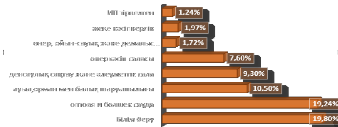
2-сурет. Әйелдердің Қазақстан еңбек нарығындағы секторлары.

Нидерландыдағы әйелдер еңбек нарығында маңызды және белсенді рөл атқарады. Олардың ел экономикасына қатысуы әлеуметтік-экономикалық даму мен гендерлік теңдікке қол жеткізу үшін айтарлықтай маңызға ие.