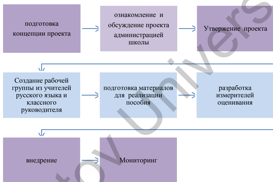
Рисунок 1. Ход работы над составлением продукта

В целях реализации вышеуказанных задач и цели решено было создать продукт (Рисунок 1).