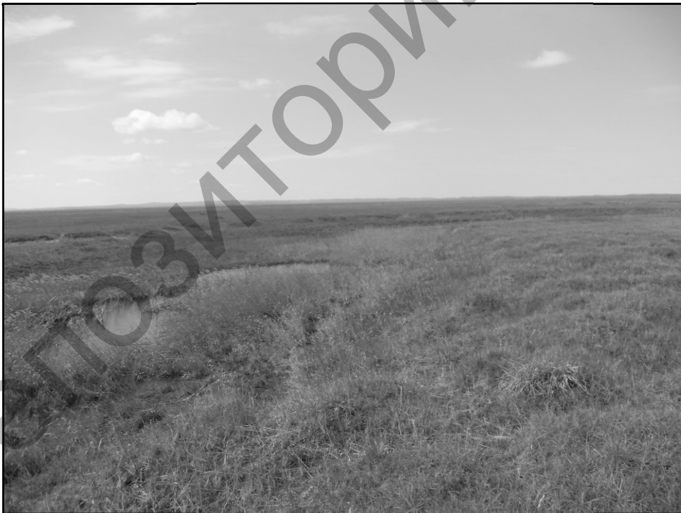
3-сурет. Матақ өзенінің жоғарғы ағысы

Матақ өзенінің арнасы (3-сур.) Қарағанды облысының Қарқаралы ауданы аумағымен созылып жатыр, ортаңғы ағысында Матақ ауылы маңынан өтеді.