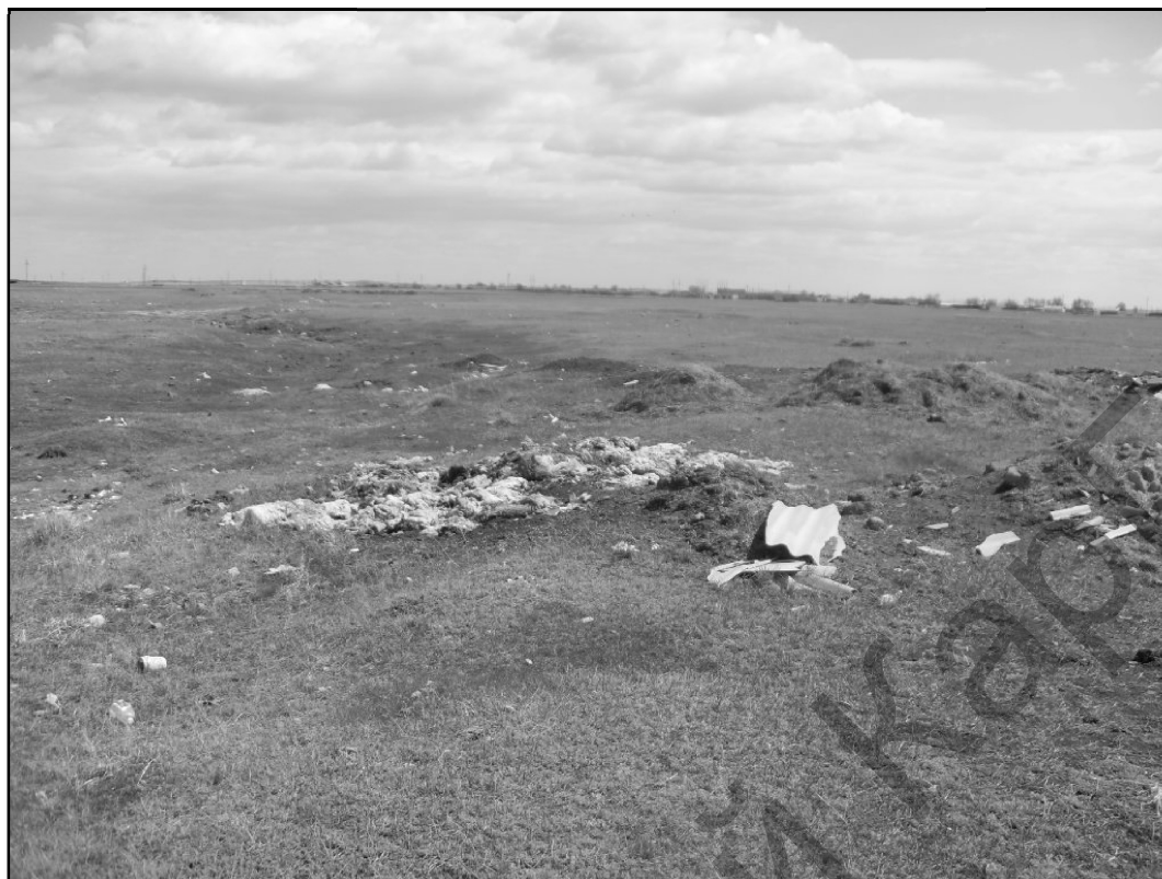
5-сурет. Өзен алабындағы коқыстар қалдығы

Мұндай көрсеткіштер әр түрлі су тасқыны кезіндегі өзендегі гидрохимиялық үдерістердің дамуын тудырады. Сол жылы топырақ күзден бері ылғалмен аз қоректенгендіктен, ол қысқа болды.