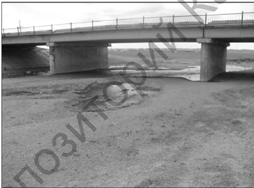
4-сурет. Ащысу бекеті маңындағы темірбетонды көпір

Матақ өзенінің жағалау аумағының жағдайын бағалау үшін жүргізілген далалық экологиялық зерттеулер барысында экологиялық зерттеу аймақтары ретінде Матақ өзенінің су қорғау аймақтары мен ені 1–2 км болатын өзен арнасының жағалауына жақын орналасқан аудандар қарастырылды. Зерттеулер Матақ өзенінің бастауынан бастап жүргізілді. Өзен маңындағы аумақтардағы антропогендік қызмет түрлері ауыл шаруашылығымен көрсетілген. Сонымен қатар өзен жағалауында транспорт желілері, қалдықтар төгілетін нысандар, электр өткізу желілері орналасқан. Матақ ауылында да осындай қалдықтар кездеседі (5-сур.).