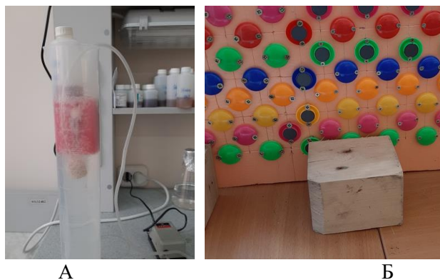
Рисунок 2 – Барботирование (А) семян и облучение в магнитном поле (Б)

Опыты по оценке и оптимизации методов повышения семенной всхожести проводили в лабораторных условиях на основе стандартных методик [8, 9]. Проращивание семян вели на чашках Петри на 2-слойной фильтровальной бумаге, смоченной дистиллированной водой. Для повышения всхожести семена помещали в одинарное и двойное магнитное поле на 24 и 72 часа, а также подвергали барботированию в стерильной воде сжатым воздухом в течение 24 часов (рис. 2).