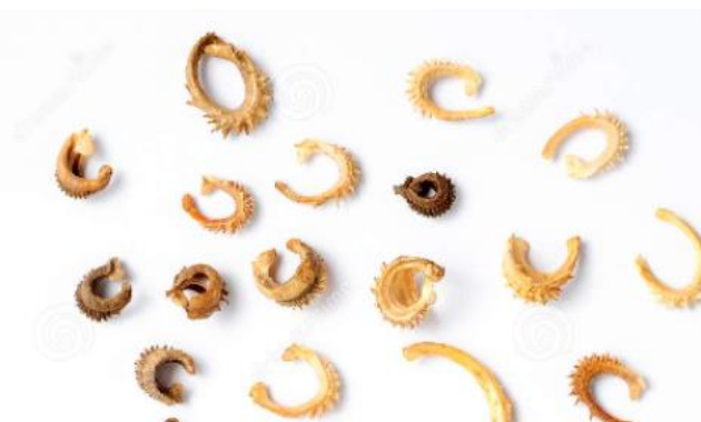
Рисунок 1 – Внешний вид семенного материала Calendula officinalis

Семенной материал был собран на территории коллекционного участка биолого-географического факультета КарУ им. Е.А. Букетова (г. Караганды), срок хранения - 4 года (рис. 1).