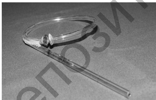
Рис. 1. На этом капилляре был осуществлен поворот на 360^\circ градусов. В дальнейшем он был разделен для ряда новых экспериментов

При этом с высокой точностью удалось получить 100 % трансмиссию пучка при повороте на 360^\circ .