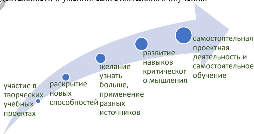
Рисунок 3 Этапы формирования независимого ученика

В этом отношении для начала очень полезно предлагать учащимся задания эвристического характера. Современный ученик - активный участник педагогического процесса, в котором самореализуется и самоутверждается. Для самореализации учащимся предлагаются участие в проектной деятельности, в том числе творческого характера. Из собственного опыта могу утверждать, что, участвуя в скетчах, театральных кружках учащиеся раскрывают в себе и для себя способности, о которых они раньше не подозревали. Раскрытие в себе творческого начала неизбежно влечёт за собой развитие языковых навыков, о чём свидетельствует приведённая гистограмма (Рис.3). Как только ребёнок вовлекается в творческую учебную деятельность, он становится более ответственным за результаты своего обучения. У учащихся возникает желание узнать больше, применяя при этом разнообразные источники. Применяя эти источники, ученик сравнивает их пользу и качество, развивая, таким образом, критическое мышление, что приводит к участию учащегося в исследовательской деятельности и умению самостоятельного обучения.