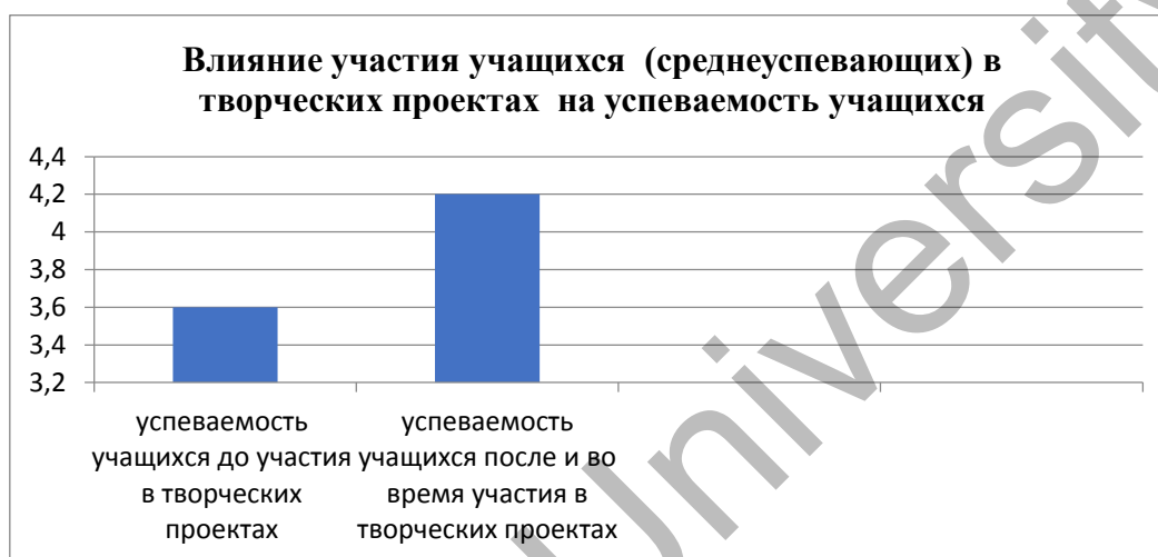
Рисунок 2. Влияние участия учащихся в творческих проектах на успеваемость учащихся

4. Мотивация Самообучение может положительно сказаться на мотивации. Учимся учиться – эта причина пересекается с некоторыми из уже упомянутых. Но, чтобы стать независимым учеником, учащийся должен пройти ряд этапов. Первый из них – это вовлечение учащегося в творческие учебные проекты (Рисунок 2).