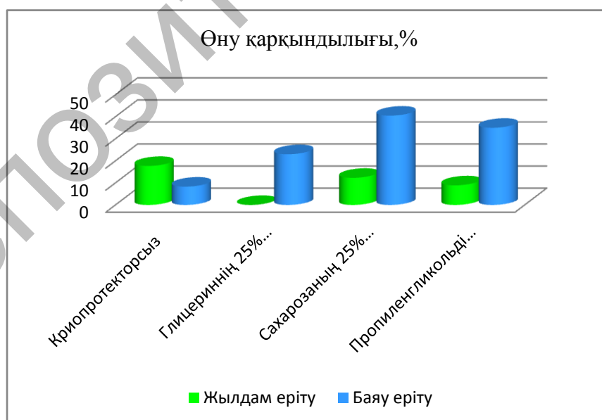
4 сурет. Криопротекторларға салынған кәдімгі меңдуана тұқымдық материалының өну қарқындылығына еріту режимін қолдану мен олардың әсері

Кәдімгі меңдуана тұқымының өнімділігі 10% және 25% глицерин ерітіндісін қолдану кезінде төмендеп, сәйкесінше 24% және 26% құрады, ал ол бақылау мәнінен 3,3% төмен. Сахароза мен пропиленгликольдің криопротекторлық заттар ретінде қабылдау барысында, пропиленгликоль үшін 25% ерітінді-45,7% және 25% ерітінді 39,2% құрап, ең жақсы концентрация олып табылды. Сахарозаның 10%-дық ерітіндісін қолдану кезінде өнімділік бақылау мәнінен жоғары 38% де 8,7% құрады, ал 10%-дық пропиленгликоль ерітіндісінде мұздату -36% құрап, бақылау тобының көрсеткіштерінен 6,7% жоғары болды (3 кесте, 4 сурет).