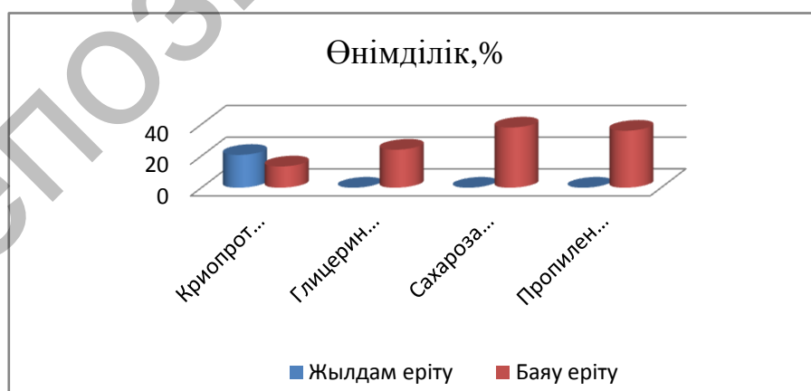
1 сурет. Криопротекторлық заттарға салынған Datura stramonium тұқымдық материалының өнімділігіне еріту режимінің әсері