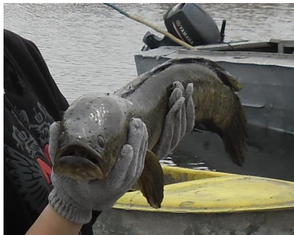
1 сурет - Балқаш көлінде ұсталған жыланбалықтың ( Channa argus ) сыртқы көрінісі

жүреді. Дертәсілдері 2 күннен кейін шығады, бірақ тағы біраз уақыт уызды қапта тұрады [3].