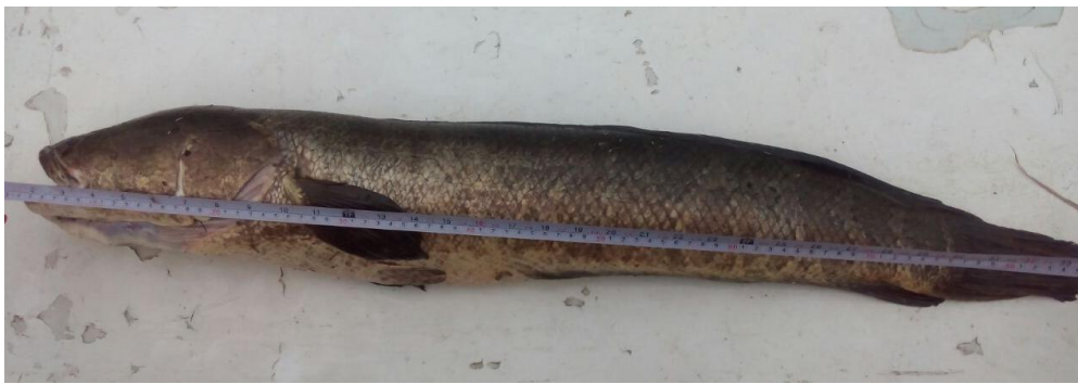
2 сурет- Жыланбалықтың ( Channa argus ) көлденең сыртқы көрінісі

Ал көліміздің балықшыларының айтуынша: “кеуіп қалған су қоймаларында қалып қалса жыланбалық тереңдігі 40-60 см-ге дейін жететін ін қазып алып сыртынан көп мөлшерде сірне бөліп келесі жауын шашын жауғанға немесе су мөлшері көтерілгенге дейін күтеді” дейді. Ал менімен тексерілген жағдай, ол бұл балықтың сусыз жерде 2 күндей өмір сүре алатындығы және соған қарамастан суды іздеп табу күштарлығы, яғни, бойынан күш қуаты бірден кете қоймайды, жанталасып суға қарай бет алуы.