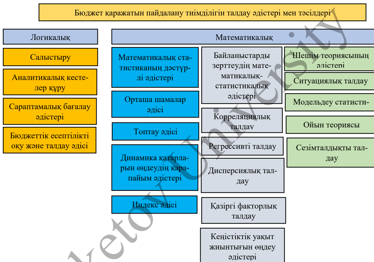
2-сурет. Бюджет қаражатын пайдалану тиімділігін талдау әдістері мен тәсілдері

Жоғары айтылғандарды ескере отырып, келесідей тұжырымдама айтуға болады, яғни мемлекеттік бюджеттің тиімділігін бағалау келесідей жүзеге асырылады (3-сурет).