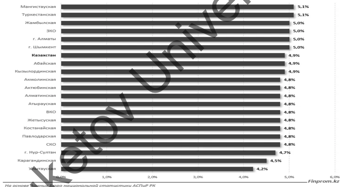
1-сурет. ҚР халқының жұмыссыздық деңгейі.

На основе данных Бюро национальной статистики АСПиР РК