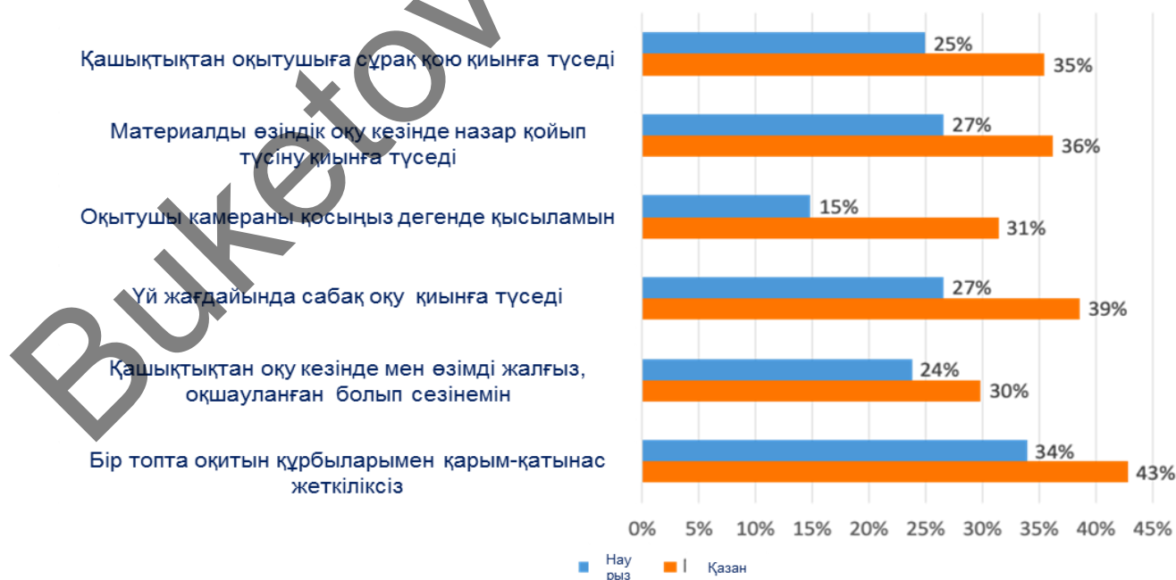
Сурет 1 – Бірінші курс студенттерінің қашықтықтан оқытуға көзқарасы

Бірақ жоғарыда айтылған пікірлерге қарамастан, жоғары білімге қол жетімділіктің теңсіздігі күшейе түсті. Халықтың табысы төмен топтарындағы студенттердің 30% - ында Қашықтықтан оқытуға қойылатын барлық функционалдық талаптарға жауап беретін техника жоқ. Сондай-ақ, студенттер қашықтыққа өту кезінде маңызды психологиялық қиындықтарға тап болады, бірінші курс студенттері ерекше қауіпті аймақта. Халықаралық университетпен жүргізілген сауалнама нәтижесін келесі 1-суреттен көруге болады.