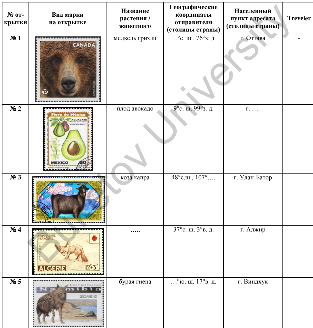
Т а б л и ц а

Необходимую информацию впишите в таблицу: