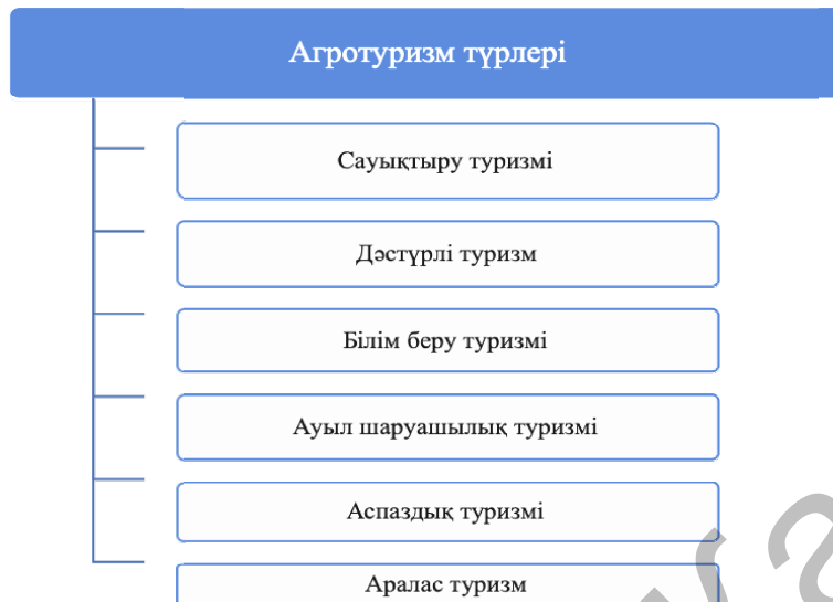
2-сурет. Агротуризмнің демалу мақсатына байланысты түрлері

Сондықтанда агротуризмнің негізгі түрлеріне сауықтыру, дәстүрлі, білім беру, ауыл шаруашылық, аспаздық және аралас туризмді жатқызуға болады (2-сур.).