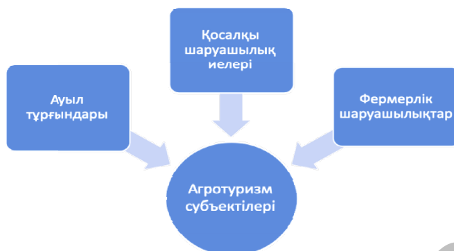
1-сурет. Агротуризм субъектілерінің құрылымы

Сондықтанда агротуризм субъектілеріне ауыл тұрғындарын, қосалқы шаруашылық иелерін және фермерлік шаруашылықтарды жатқызуға болады (1-сур.).