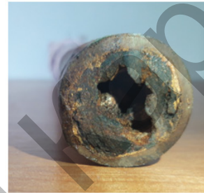
ә) құбыр диаметрі бойынша қақтың фотосуреті