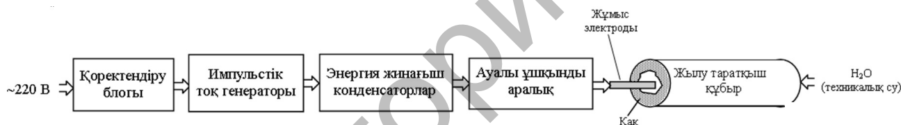
1-сурет. Электргидравликалық қондырғының блок сұлбасы

Аталған мәселелерге байланысты жылу тарату құбырларын қатты шөгінділерден тазалау мақсатында электргидравликалық қондырғы жинақталды. Электргидравликалық қондырғы қоректендіру блогынан, конденсаторлардан, түрлендіргіш аралықтан, жұмыс электродтарынан тұрады (1-сур.). Конденсаторлардың энергиясы сұйық ортаға батырылған электродтардың жұбына беріледі. Разряд қалыптасуы кезінде энергияның басым бөлігі жұмыстық электродтар арасындағы сұйық орта көлеміне жұмсалады. Бұл кедергі шамасының, қондырғының басқа бөліктеріне қарағанда, жұмыс арнасында көп болатындығымен түсіндіріледі.