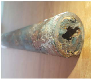
а) диаметрі 32 мм құбыр

Зерттеу жұмыстары кезінде ұзындығы 100 мм, диаметрі 32 мм құбырларды тазалау жұмыстары жүргізілді (2-сур.). Құбырлардың ішкі бетіндегі қақтың қалыңдығы қатты қабырғадан есептеген кезде 9 мм екені анықталды. Құбырдың ішкі диаметрі 32-мм-ден 14-мм-ге дейін азайғандықтан, сәйкес деңгейде берілетін сұйықтың мөлшері де кемиді. Тазартылуына қарай, электрод құбырдың барлық ұзындығы бойынша қарама-қарсы жаққа дейін қозғалады. Бір құбырды тазартқаннан кейін электрод келесі құбырға салынып, тазалау жұмыстары жалғастырылады.