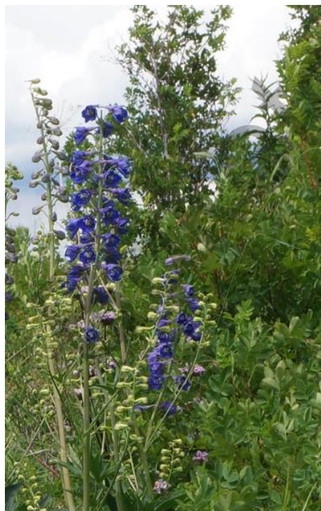
Рисунок 1. Живокость сетчатоплодная ( Delphinium dictyocarpum DC.). Хребет Джунгарский Алатау, ущелье Монакова

Луговая растительность склонов гор складывается из разнотравно-злаковым покровом с преобладанием вейника надземного ( Calamagrostis epigeios Roth.), костра безостого ( Bromus