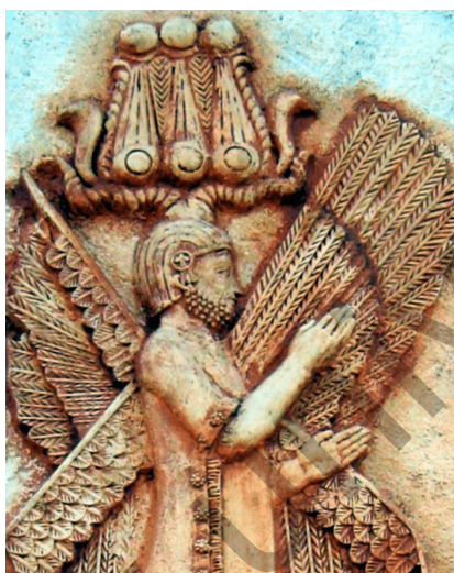
5-сурет. Пасаргадтағы Мысыр құдайларының бас киімін киіген қос мүйізді Кир II (Куруштың) бедерлі мүсіні [27].

Көптеген халықтарда: мысырлықтар, немістер, шумерлер және басқа да көптеген халықтарда мүйіз құдірет белгісі боп саналды. Грек пантеонының басты құдайы Зевс қошқар мүйізімен бейнеленді. Мүйізі бар дулығаларды патшалар киген. Мұсылман халықтарының фольклорында екі мүйізді Ескендір (Құрандағы Зу-ль-қарнайын, القرن ین ذو , араб тіл. ауд. – қос мүйіз иесі) Алла құдірет беріп, жердің екі шетіне, Шығысы мен Батысына, «күн шығатын» және «күн бататын» жерге [24] дейін жетуге мүмкіндік берген ислам дінінің жақтаушысы, Мұхаммедке дейін өмір сүрген Жаратушы елшісі және пайғамбары болып саналды. Е.А. Костюхин [25: 125-126] «Александр Македонский әдеби және фольклорлық дәстүрде» деген кітабында этнограф Д.И. Эварницкий (1893) және Г.Н. Потаниннің (1916) халық аузынан жазып алған қос мүйізді Ескендір туралы қазақтың екі халық аңызын мысал ретінде келтіреді. Алайда Зу-ль-қарнайынның түп тұлғасы Ескендір (Александр Македонский) емес, Кир II болған деген пікір де бар [26], (5-сурет).