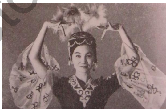
4-сурет. «Киік мүйіз» қол қалпы

Түркі халықтарының наным-сенімдері бойынша көшпелі халықтың негізгі тағамы болып, мүйізі май болған жануар қошқардың мүйізі «құт» — күш, сәттілік, бақытпен барабар саналды. «...Қазақтар арасында кеңінен танымал бұл түсінік Орта Азия, Оңтүстік Сібір, Моңғолия, Солтүстік Кавказ, Үндіқытай, Африка халықтарының ұқсас ұғымдарымен сәйкес келеді. Көне дәуірде «От-Аспанмен» байланысты сәттілік, ұрпақ сыйлайтын «ғарыштық қошқарға» табынудың кең тарағанын көне мысырлықтарда қошқар басы бар сфинкстер түріндегі күн құдайы Амонның бейнелері; Кушан мен Хорасан, Ферғана патшаларының алтын қошқар түріндегі тақтары; аргонавтардың алтын жүнді қошқар терісі үшін жорығы және т.б. дәлелдейді. Осы нанымдарға ежелгі ирандық Фарнның бір