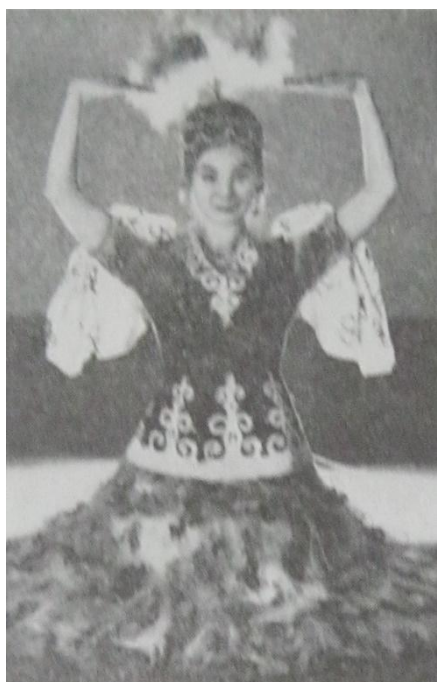
2-сурет. «Қошқар мүйіз» қол қалпы