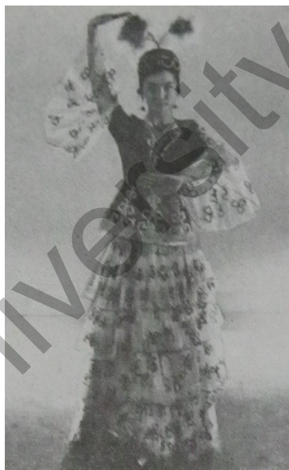
3-сурет. «Сыңар мүйіз» қол қалпы