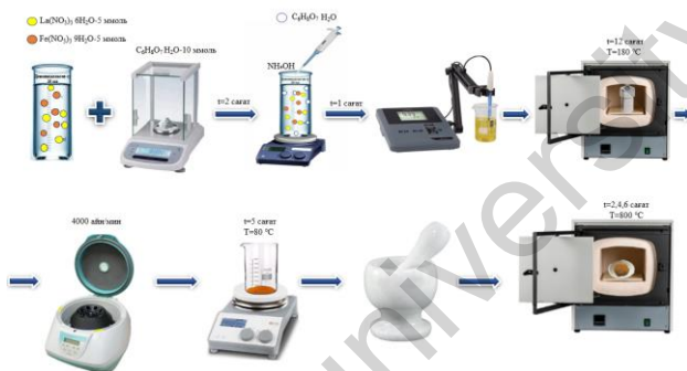
1-сурет. \text{LaFeO}_3 перовскитінің синтез әдісі.

суда 2,165 г \text{La}(\text{NO}_3)_3 \cdot 6\text{H}_2\text{O} және 2,02 г \text{Fe}(\text{NO}_3)_3 \cdot 9\text{H}_2\text{O} ерітілді. Ерітіндіге 2,1 г \text{C}_6\text{H}_8\text{O}_7 \cdot \text{H}_2\text{O} қосып, қоспа бөлме температурасында 2 сағат араластырылды. Ерітіндінің рН мәні \text{NH}_4\text{OH} көмегімен 9-ға дейін реттеліп, қосымша 1 сағат араластырылды. Дайындалған қоспа 50 мл көлемді тефлонды автоклавқа салынып, 180^\circ\text{C} температурада 12 сағат бойы муфельді пеште ұсталды. Одан кейін центрифугалау әдісімен тұндырылып, деионизделген сумен және этанолмен жуылды. Соңынан 80^\circ\text{C} температурада 5 сағат кептіріліп, 800^\circ\text{C} -та 2, 4 және 6 сағат бойы термиялық өңдеуден өткізілді.