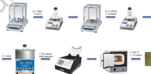
2-сурет. \text{LaFeO}_3 перовскитін FTO шыныларына жағу әдісі.

2-суретте \text{LaFeO}_3 перовскитін FTO шыны бетіне жағу әдісі кезең-кезеңімен көрсетілген. Алдымен 5 мл деионизделген суға 0,1 г поливинил спирті (ПВС) қосылып, алынған қоспа 60^\circ\text{C} температурада магнитті араластырғышта үздіксіз араластырылды. ПВС толығымен ерігеннен кейін, оған алдын ала синтезделген 0,1 г \text{LaFeO}_3 перовскиті қосылды.