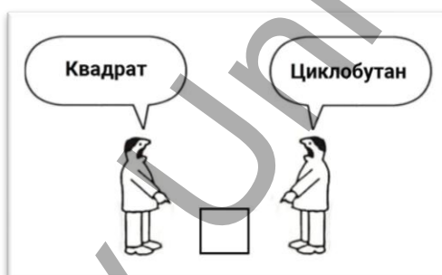
3-сурет. Циклобутанның геометриялық аналогиясын сипаттайтын мем түрі

Пән аралық байланыс ретінде математика мен химияны таңдауға болады, мысалы 3-суретте циклобутанның геометриялық аналогиясын сипаттайтын мем түрі бейнеленген.