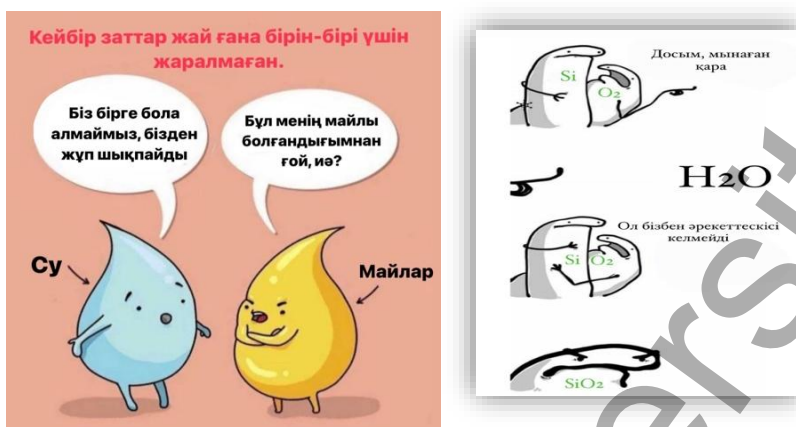
1,2-сурет. Сабақта қолданылған мем үлгілері

Мысал 2: Кремний оттектен әрекеттесіп, \text{SiO}_2 түзеді, бірақ қалыпты жағдайда сумен әрекеттеспейді. Мем реакциялардың таңдаулылығын юмор арқылы көрсетеді. барлық заттар бір-бірімен әрекеттеспейді және кремний суды емес, оттегін «жақсы көреді».