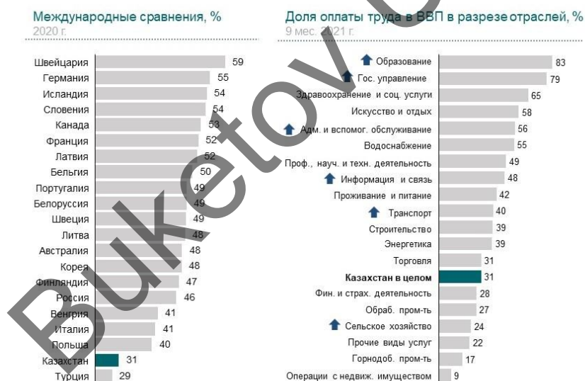
Рисунок 1 Сравнение доли оплаты труда в ВВП

Рассмотрим нынешнюю модель экономики Казахстана. В 2000-х годах случился экономический бум, однако в последующих пятилетках реальный рост экономики снижался. Это показывает, что экономическая модель страны использовала все имеющиеся источники роста. Ни для кого не секрет, что в первую очередь это связано с нашей сырьевой направленностью. Но мало кто акцентирует своё внимание на таком факторе, как вклад в экономический рост. За последние десять лет такой вклад на 62% был обеспечен сферой услуг, также на 23% сферой торговли. Эффективность труда в сфере услуг Казахстана находится на низком уровне, при этом она не повышается на протяжении последних десяти лет. В то же время эффективность нормально функционирующих экономик напрямую влияет на уровень доходов и оплаты труда. Именно вышеупомянутые перекосы связаны со снижением доли заработной платы. Помимо всего озвученного на данный момент в Казахстане наблюдается очень низкая доля оплаты труда в структуре ВВП, она составляет лишь 31%. Иными словами, рабочие получают низкие зарплаты. В большинстве у соседних стран данные показатели ощутимее выше, чем в Казахстане.