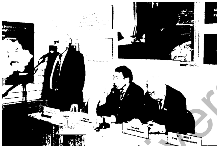
Академик Е.А. Бөкетовтың мемориалдық музейінің жөнделіп, жаңартылғаннан кейінгі сәтінде Қамзабай Арыстанұлы Бөкетовтың ашылуда сөз сөйлеуі