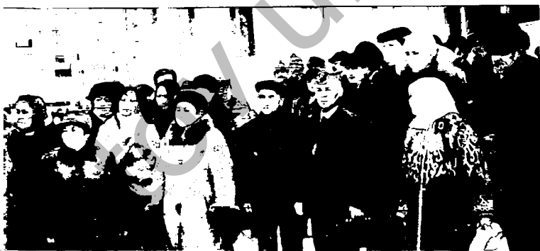
ҚарМУ-дің алғашқы ректоры, академик Е.А. Бөкетов ескерткішінің орнына тас қоюға қатысушылар