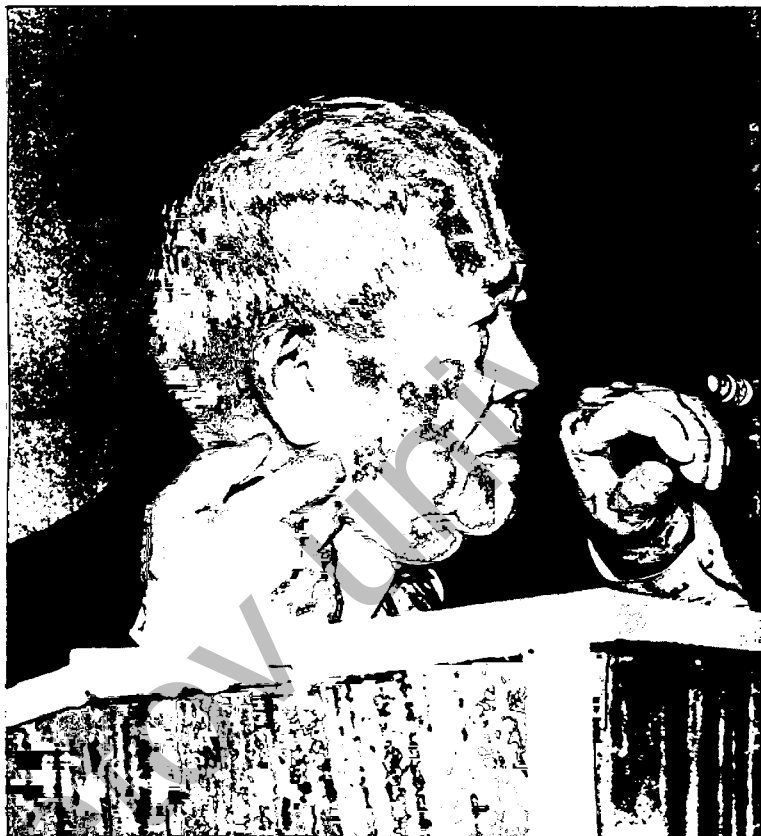
Е.А. Бөкетовтың студенттік досы, ҚазССР ҒА академигі Ғ.Р. Бекжанов сөйлеуде