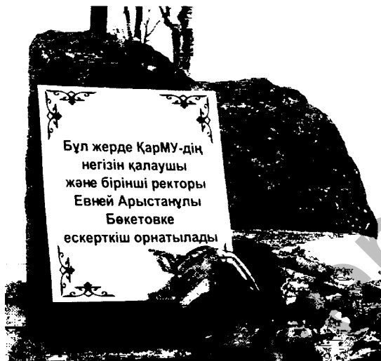
ҚарМУ-нің алғашқы ректоры, академик Е.А. Бөкетовке орнатылатын ескерткіштің орнына белгі тас қою