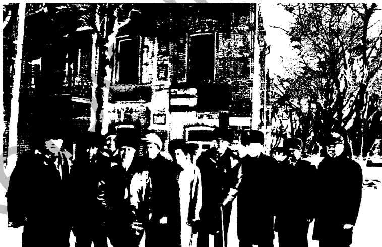
Конференцияға қатысушылар Петропавл қаласының көрнекті жерлерімен танысуда