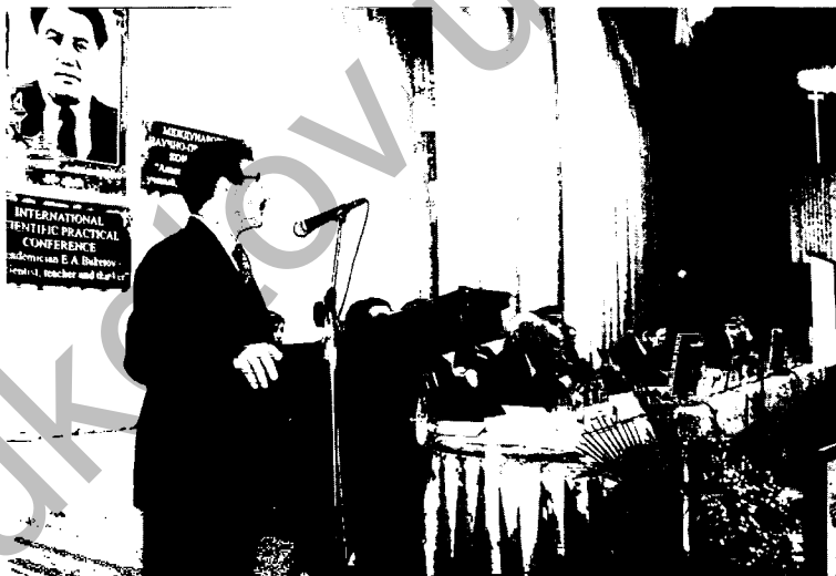
Сөз сөйлеп тұрған ҚР ҰҒА академигі, фитохимия институтының директоры Әдекенов С.М.