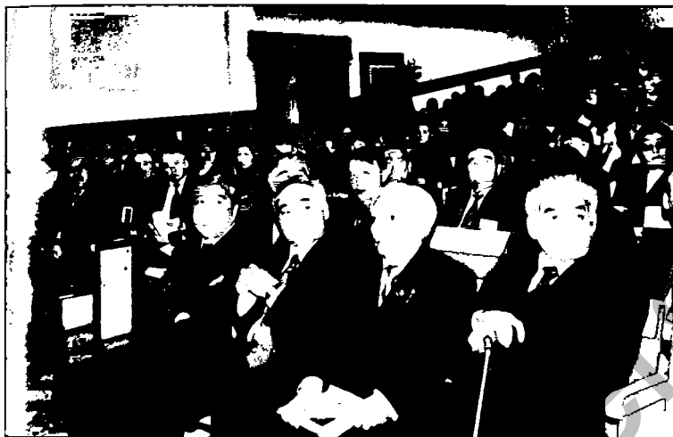
Конференцияға қатысушылар Петропавл қаласында