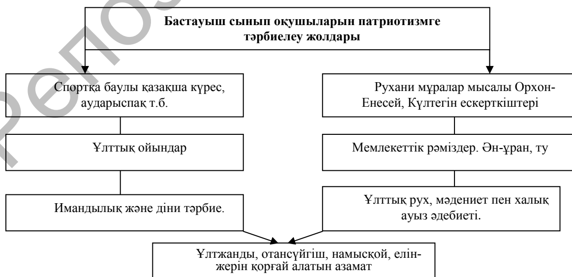
Сурет 1. Бастауыш сынып оқушыларын патриотизмге тәрбиелеу жолдары.

Осы мәліметтерді негізге ала отырып бастауыш сынып оқушыларын патриотизмге тәрбиелеудің жолдары айқындалды (Сурет 1.)