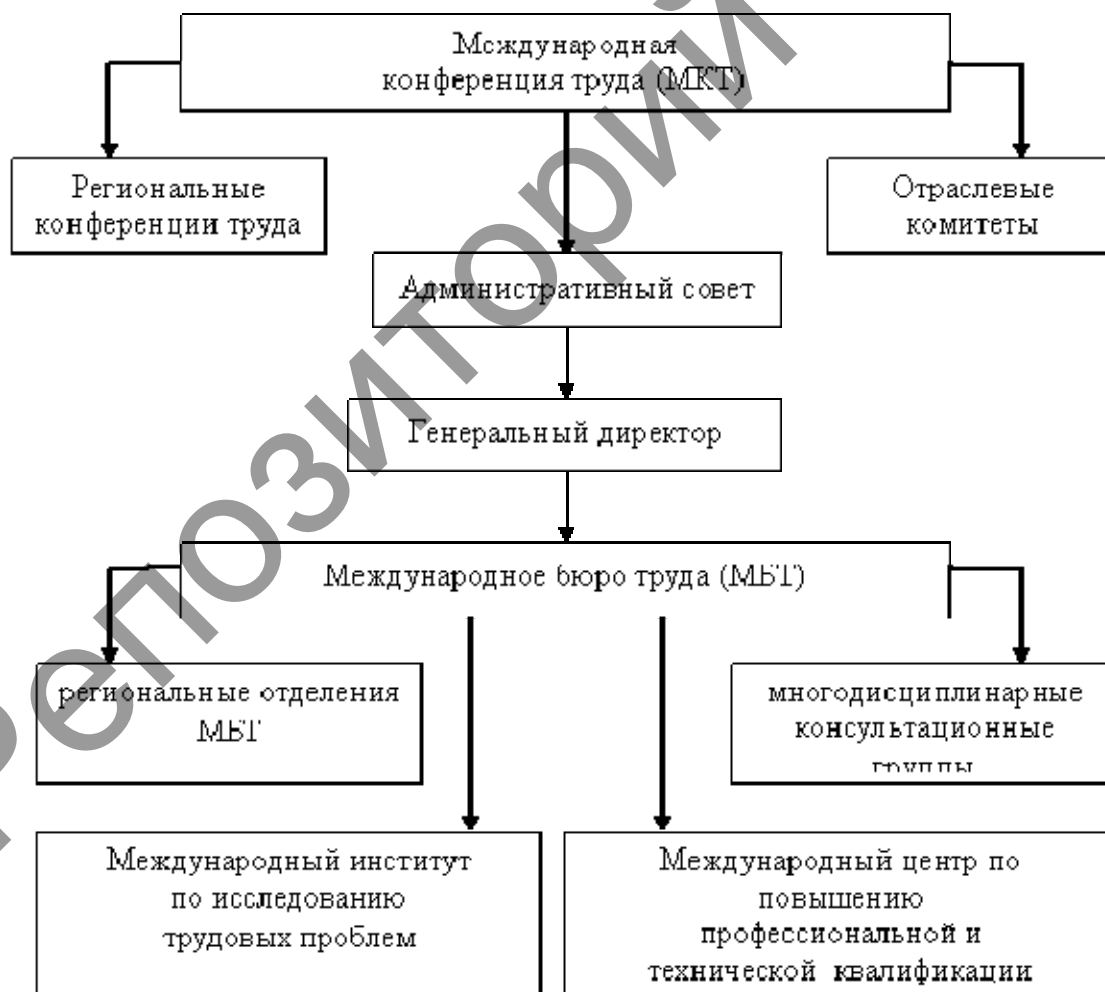
Рис. 1. Структура Международной организации труда