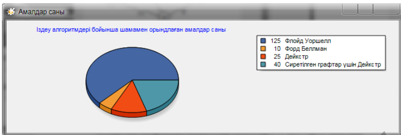
29 сурет. Орындалған амалдар саны

3 сурет терезесінен ең қысқа жолды табудың қолданылған барлық алгоритмдерін, сонымен қатар, әрбір алгоритм бойынша салыстыру санын көруге болады. Іздеу алгоритмі бойынша шамамен орындалған амалдар санының салыстырмалы диаграммасын аламыз. Дипломдық жұмыс барысында ең қысқа жолды анықтаудың математикалық моделі қарастырылып, граф бойынша қысқа жолды іздеу алгоритмдері қарастыратын программалық қамтама құрылды. Бұл бағдарлама кез келген кәсіпорын арасында корпоративтік желі құруда, тасымалдау есептеріндегі ең қысқа маршрутты анықтауда тиімді шешім қабылдауда таптырмайтын өнім болып табылады.