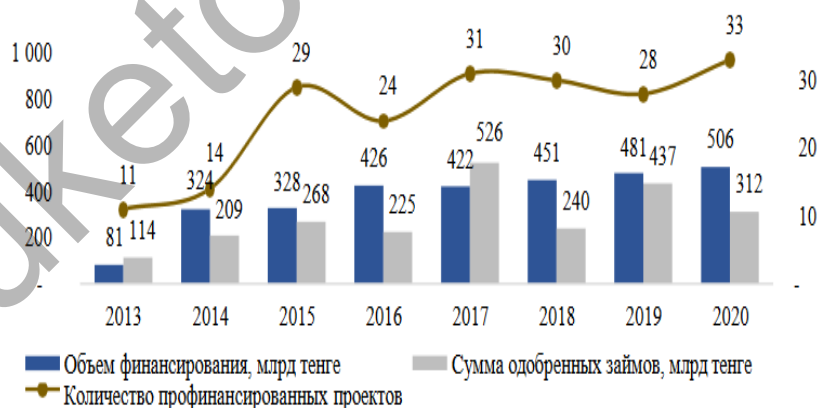
1-сурет Қазақстан Республикасының экономикасын қаржыландыру серпіні.

Даму Банкі өңдеу өнеркәсібі мен инфрақұрылымдағы ірі жобаларды несиелеуде үдемелі өсуді көрсетіп отыр. Мәселен, 2013 жылдан 2020 жылға дейінгі кезеңде Даму Банкінің несиелік портфелі 379 млрд теңгеден 1 971 млрд теңгеге дейін өсті (өсім 420% - ға), қарыздар мен кепілдіктердің жалпы сомасы шамамен 2 329 млрд теңгеге 103 мәміле мақұлданды, несиелік қаражатты игеру көлемі 3 019 млрд теңгені құрады (1 сурет).