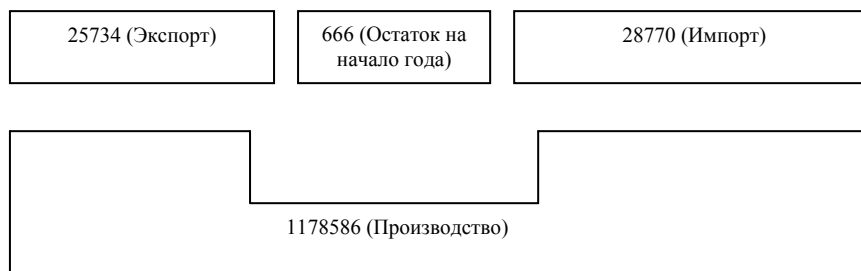
Рисунок 3. Соотношение всех видов ресурсов яиц и яичных продуктов и их использование за 2012 г. (в тыс. штук)

Вместе с тем следует отметить, что до последнего времени спрос на яйцо покрывался в основном за счет импортных поставок и лишь на 45 % за счет внутреннего производства. Для преодоления этого отставания, при содействии Национального фонда поддержки предпринимательства (НФПП) при Министерстве экономического развития Азербайджана, с июня 2010 г. начался процесс создания 12 новых птицеводческих хозяйств, ориентированных на производство племенных яиц. Шесть из них будут созданы в Абшеронском экономическом регионе, три — в Аранском и по одному — в Горно-Ширванском, Гянджа-Газахском, Шеки-Загатальском регионах Азербайджана. Стоимость всех 12 проектов по развитию птицеводства оценивается в более чем 40 млн азербайджанских манатов, 26 млн из которых выделит НФПП.