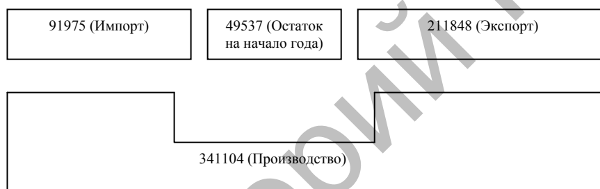
Рисунок 4. Соотношение всех видов ресурсов сахара и сахарных продуктов и их использование за 2012 г. (в тоннах)

Вместе с тем следует отметить, что до последнего времени спрос на яйцо покрывался в основном за счет импортных поставок и лишь на 45 % за счет внутреннего производства. Для преодоления этого отставания, при содействии Национального фонда поддержки предпринимательства (НФПП) при Министерстве экономического развития Азербайджана, с июня 2010 г. начался процесс создания 12 новых птицеводческих хозяйств, ориентированных на производство племенных яиц. Шесть из них будут созданы в Абшеронском экономическом регионе, три — в Аранском и по одному — в Горно-Ширванском, Гянджа-Газахском, Шеки-Загатальском регионах Азербайджана. Стоимость всех 12 проектов по развитию птицеводства оценивается в более чем 40 млн азербайджанских манатов, 26 млн из которых выделит НФПП.