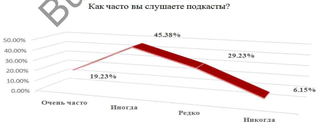
Рисунок 2. Частота прослушивания подкастов

Полученные данные показали, что 19,2 % респондентов часто слушают подкасты, а 29,2 % — редко. Это свидетельствует о том, что, несмотря на удобный формат подачи информации, только небольшая часть регулярно слушает подкасты. При этом подавляющее большинство участников (105 респондентов) относятся к молодёжной аудитории (Рис. 2).