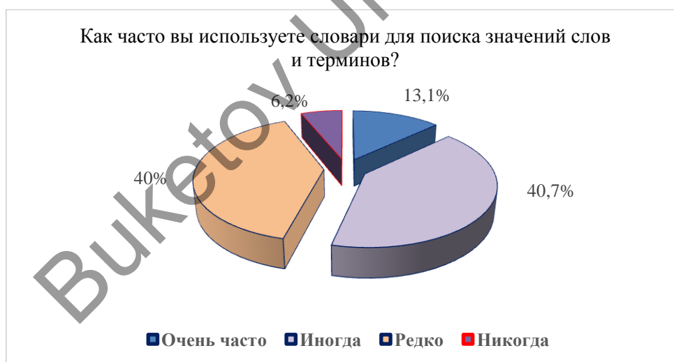
Рисунок 4. Частота использования словарей для поиска значений

Использование словарей также оказалось довольно распространённым: 40,7 % респондентов обращаются к ним время от времени, 13,1 % — очень часто, и лишь 6,2 % никогда не прибегают к их использованию (Рис. 4).