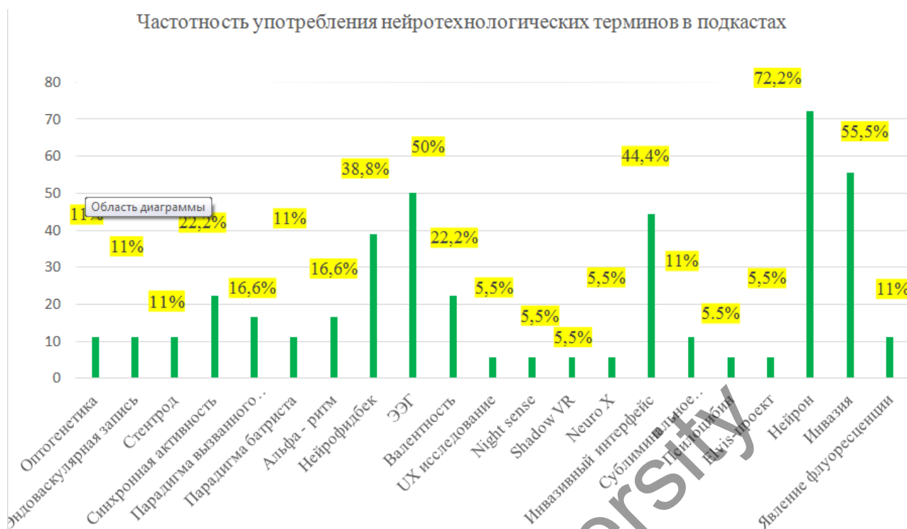
Рисунок 1. Частотность употребления нейротехнологических терминов в подкастах

Наибольшее количество упоминаний получили базовые термины, такие как «инвазия» — 10 упоминаний (55,5 %), «нейрон» — 13 упоминаний (72,2 %), «ЭЭГ» — 9 упоминаний (50 %), «инвазивный интерфейс» — 8 упоминаний (44,4 %).