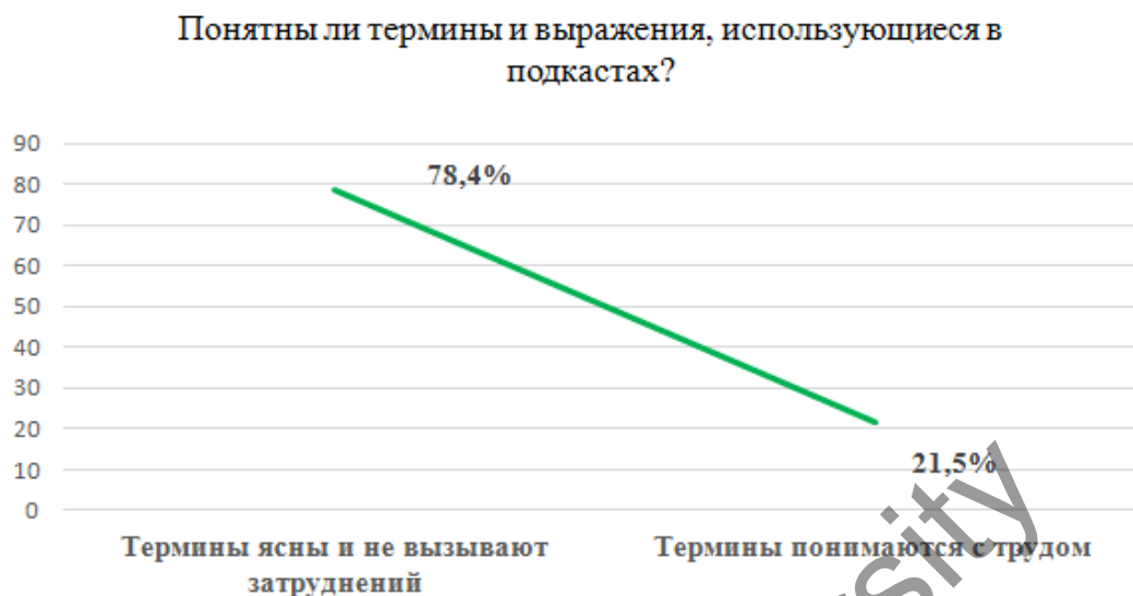
Рисунок 3. Понимание терминов в подкастах

При этом 52,3 % респондентов опроса догадываются о значении незнакомых слов по контексту, 36,9 % обращаются к словарям, а остальные используют переводчики, интернет-ресурсы или искусственный интеллект.