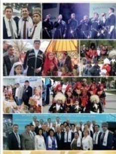
«Джорджия:2007» грузин қоғамдық-мәдени орталығы