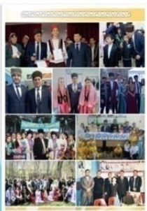
«Намус» азербайжан ұлттық мәдени орталығы