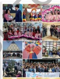
Қарағанды облысы корейлерінің этномәдени бірлестігі