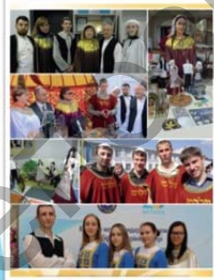
Қарағанды еврей мәдениетінің орталығы