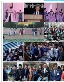
«Дағыстан» ұлттық мәдени орталығы