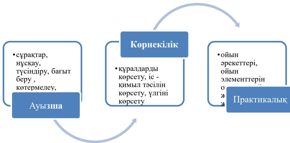
Сурет 1. Балалардың ойын арқылы логикалық ойлау қабілетін дамытудың әдістері

Ересек топ балаларының ойын арқылы логикалық ойлау қабілетін дамытуда қолданылатын әдістерге тоқталсақ. Ойын әрекеті арқылы ересек топ балаларының логикалық ойлауын дамыту әдістерінің бірі - ауызша түсіндіру әдісі. Бұл оқыту мен тәрбиелеу процесінде кең қолданылады. Тәрбиеші ересек топ балаларының ойынның шартын, маңызын т.б. ауызша айтып түсіндіріп, сұрақтар қойып жауабын тындап, қажет болған жағдайда толықтырады. Сондай - ақ, балаға нұсқау беріп, бағыт беріп, тапсырманы орындауға қызығушылығын арттыру маңызды болып табылады. Ересек топ балаларының атқарған ісіне сәйкес көтермелеу, мадақтау әдістерін де тәрбиеші қолданған жөн. Баланы мадақтау оның өзіне сенімділігін қалыптастырып, алдағы іске ынтамен кірісуіне ықпалын тигізеді. Сол себепті әр тәрбиеші баланы орынды мадақтауды ескеру қажет.