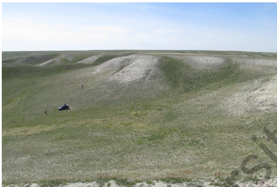
Рисунок 2. Типичные местообитания C. tataria на меловых сопках

В пределах исследуемого района на поверхность выходят глинисто-карбонатные породы мощностью до 300 м. В литологическом отношении они представлены известковыми глинами и мергелями с прослойками писчего мела, в некоторых случаях преобладает чистый мел. Кроме того, некоторые популяции C. tataria приурочены к обнажениям крутых склонов с выходами на поверхность плотных слоев коренной толщи и мела [27].