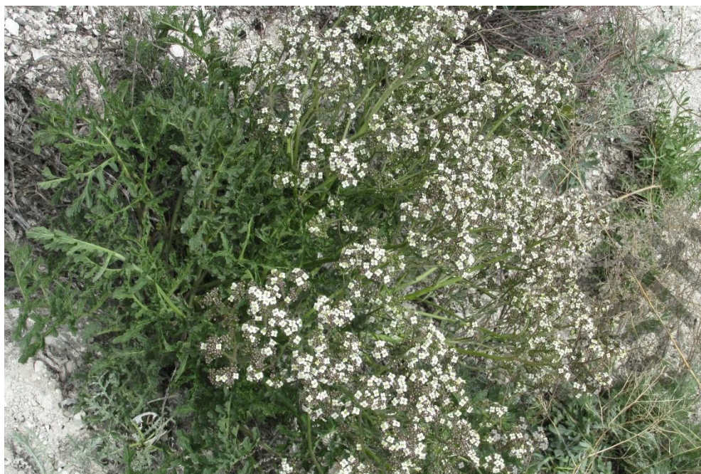
Рисунок 1. Crambe tataria на склоне меловых сопок

(рис. 1) [14–18]. На протяжении всего ареала C. tataria встречается редко, его местообитания часто разрушаются, а само растение нуждается в повсеместной охране [19, 20].