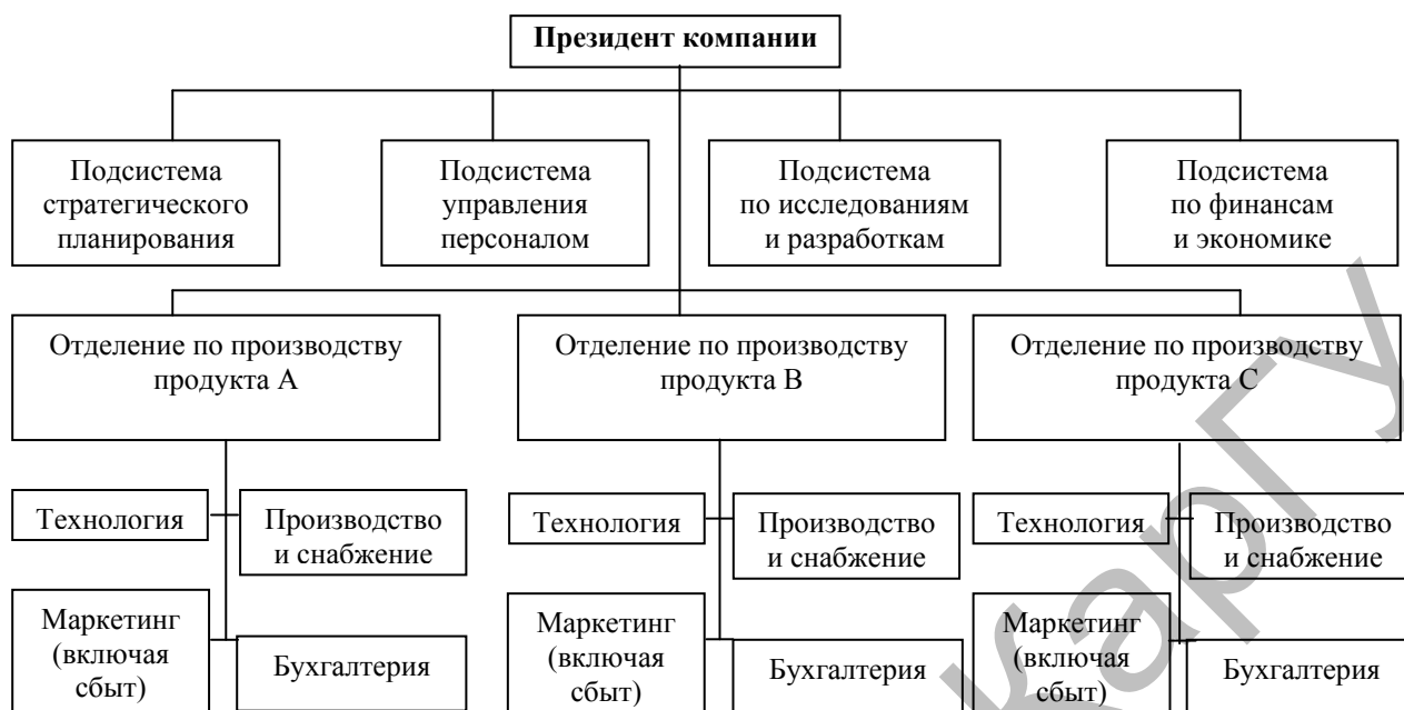
Рисунок 2. Дивизионально-продуктовая структура

Руководители функциональных служб (производственной, снабженческой, технической, бухгалтерской, маркетинговой и т.д.) должны отчитываться перед управляющим по этому продукту.