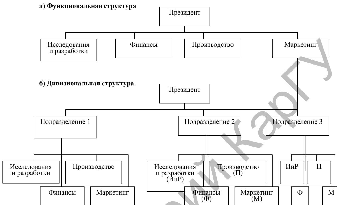
Рисунок 1. Функциональная и дивизиональная организационные структуры

На рисунке 1 сравниваются функциональная и дивизиональная структуры.