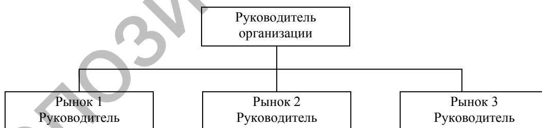
Рисунок 3. Дивизиональная рыночная структура управления (потребительская специализация отделений)

Структуризация организации по рынкам с ориентацией на потребителя — потребительская или рыночная специализация, по данным работы [6; 230], представлена на рисунке 3.