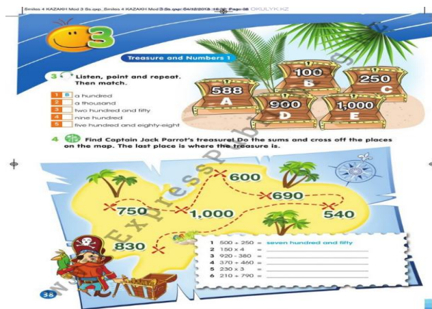
Рисунок 1. Простые вычисления из учебника английского языка 4 класса.

Вашему вниманию пример из учебника английского языка 4 класса, где ученикам предлагают произвести простые вычисления на иностранном языке (Рисунок 1).