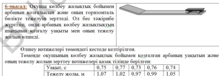
2-сурет. Тапсырма үлгісі

Толық жауапты тапсырмалар. Зерттеу және тәжірибелерді жоспарлау. Екі тапсырма білім алушылардың өз бетінше зерттеу жүргізу және эксперименттерді жоспарлау дағдыларын бағалайды. Бір