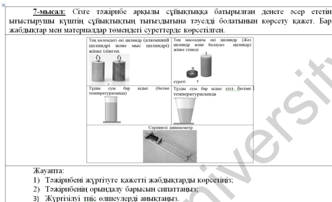
3-сурет. Тапсырма үлгісі

тапсырма теориялық сипатта болады (7-мысал, 3-сурет). Бұл тапсырмада білім алушыларға берілген тәжірибенің мақсаты бойынша қажетті құрал-жабдықтарды артық берілген тізімнен таңдау ұсынылады. Одан кейін тәжірибені жүргізу ретін сипаттап, қажетті өлшеулерді түсіндіріледі.