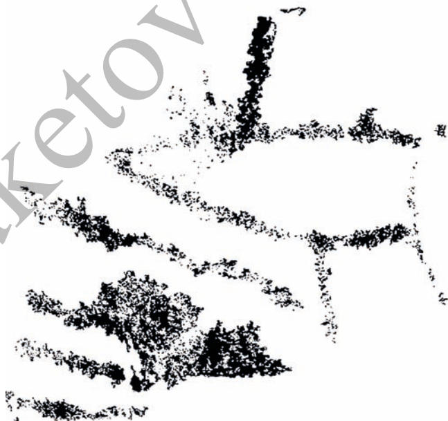
Рис. 2. Зооморфное изображение. Плоскость-1. Обрисовка через приложение «Photoshop». Авторский рисунок

Зооморфные образы являются одним из самых распространенных видов наскальных изображений Забайкалья. Прежде всего под зооморфными изображениями следует иметь ввиду те рисунки, которые в общих чертах напоминают животных.