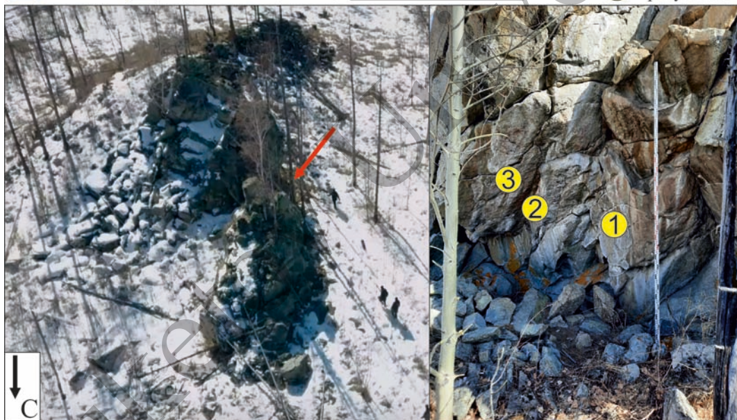
Рис. 1. Топоплан местности. Вид останца сверху.

▲ - памятник ▲ - гора Палласа (1236 м) 0 1 км ① - плоскость с рисунками