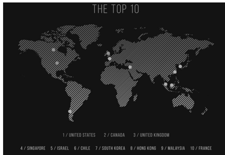
Рис.2. Страны – лидеры по социальному предпринимательству (2016г.)

Как показывает карта, топ-10 имеет международный окрас: от Чили до Южной Кореи; социальное предпринимательство растет по всему миру.