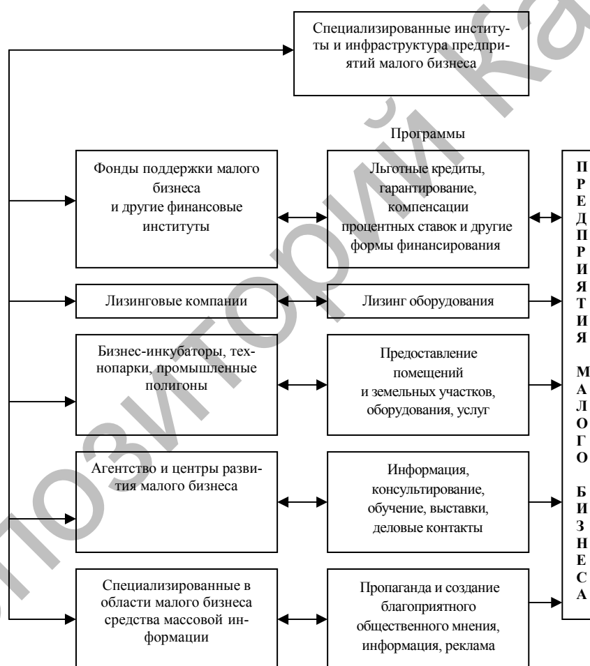
Рис. 2. Специализированные институты и инфраструктура предприятий малого бизнеса

Сходство концептуальных подходов позволяет выделить из всего многообразия элементов инфраструктуры некоторые элементы, общие для большинства зарубежных стран. К ним относятся: