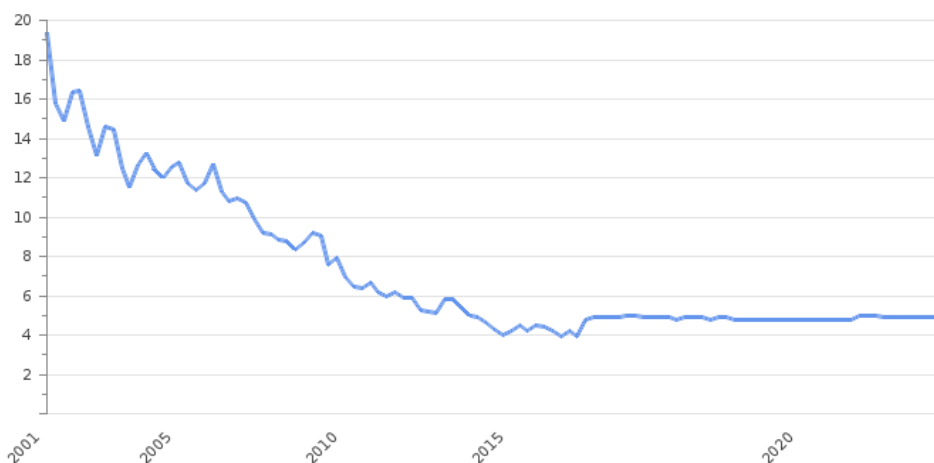
2-сурет. Қарағанды облысындағы жұмыссыздық деңгейі 2022 жыл.

-Жұмыспен қамтылған халық 324 544 / 65.2%