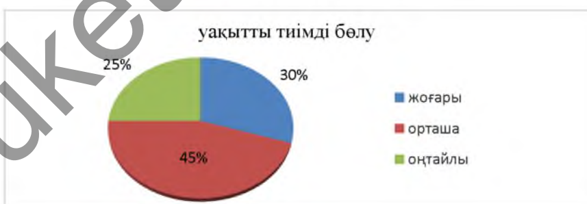
3-сурет. Бір аптаға тапсырмаларды тиімді жоспарлау

2) оқу жүктемесімен қатар, өзіндік жұмыс тапсырмаларын аптасына біркелкі етіп бөлуге қатысты сұрақтың нәтижесі (3-сурет).