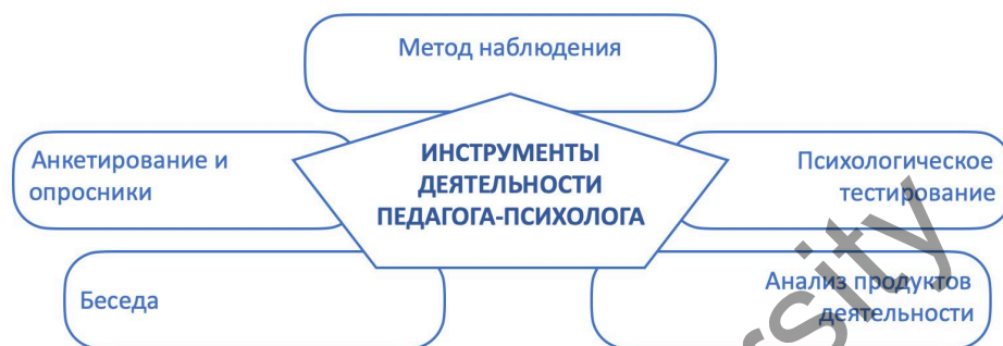
Рисунок 3. Основные инструменты психолога-педагогической деятельности

Инструментов психолога-педагогической деятельности разработано достаточно. Представим и рассмотрим основные инструменты психолога-педагогической деятельности педагога-психолога в работе с обучающимися (рис.3).