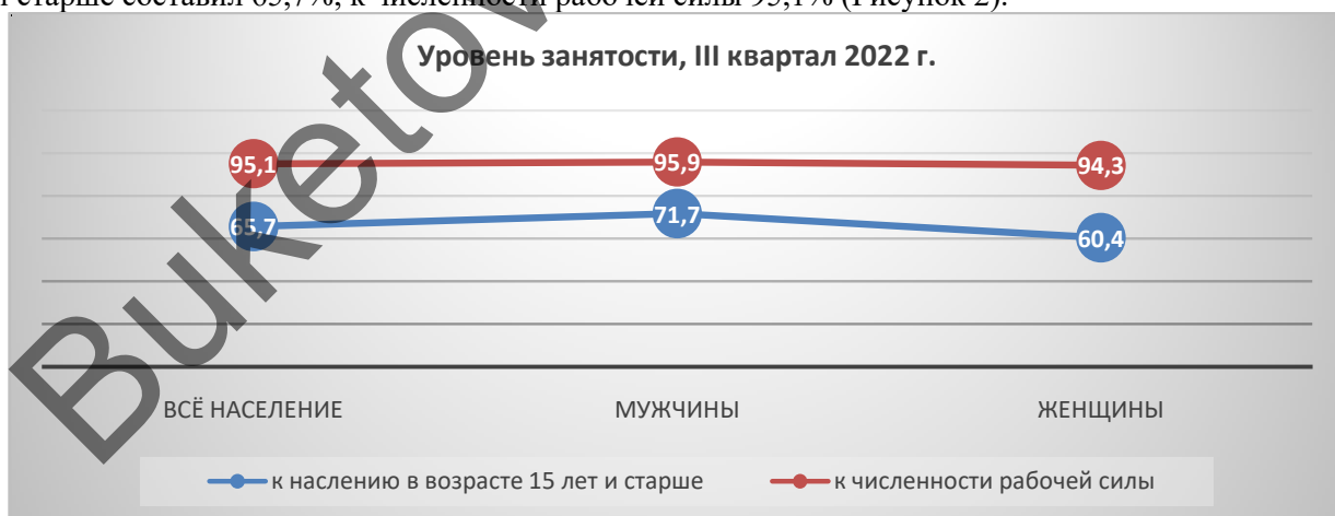
Рисунок 2. Уровень занятости населения в Республике Казахстан, % П р и м е ч а н и е – Составлено автором по источнику [1]

Однако реальная картина разительно отличается. Чтобы это понять, необходимо посмотреть, как рассчитывают уровень безработицы в Республике Казахстан. Существенная часть жителей Республики Казахстан относится к самозанятым, при этом их доходы и деятельность носят абсолютно разный характер. В их число входят работники, которые работают на семейных предприятиях и чьи доходы порой не дотягивают до прожиточного минимума. Также важно помнить, что для причисления к числу безработных, человеку необходимо обратиться в центр занятости населения по своему месту жительства или через портал «электронного правительства». Тем не менее весомая часть граждан предпочитает искать работу самостоятельно, в интернете или же через знакомых, нежели обращаться в центр занятости населения. Именно поэтому статистические данные далеки от реального положения дел. Для осознания всей серьезности ситуации необходимо обратить внимание на внутреннюю миграцию, которая продолжает расти в том числе из-за безработицы. Со слов Президента Касым-Жомарта Токаева: «Лишь половина высших учебных заведений страны обеспечивает 60-процентный уровень трудоустройства своих выпускников» [2]. По данным ВШ квартала 2022 года уровень занятости к населению в возрасте 15 лет и старше составил 65,7%, к численности рабочей силы 95,1% (Рисунок 2).