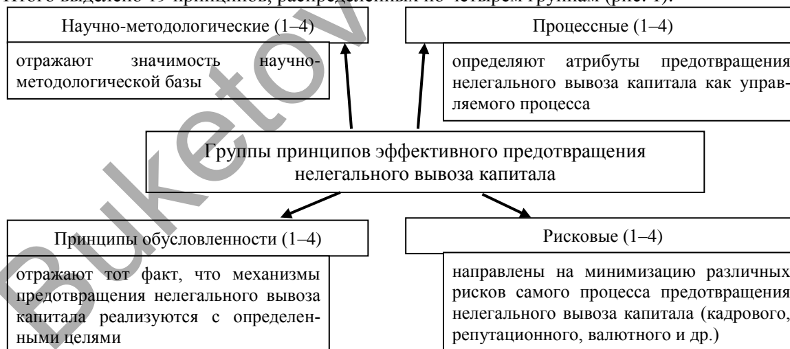
Рисунок 1 — Классификационные признаки групп принципов предотвращения нелегального вывоза капитала Примечание — авторская интерпретация условий успешного предотвращения нелегального вывоза капитала

Итого выделено 19 принципов, распределенных по четырем группам (рис. 1).